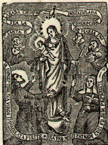
N. S. DE LA PROVIDENCIA.