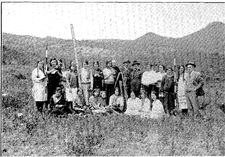
Grupo de alumnos del 4.º curso, haciendo trabajos topográficos

trasladaron el taquímetro a los vértices B y C y colocando la mira parlante en el vértice