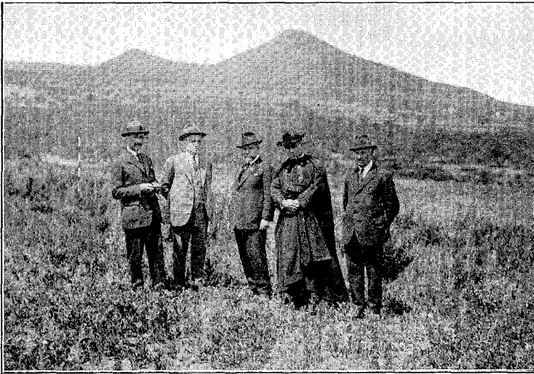
Patronato de la Junta de la Asociación de Estudiantes de Bachillerato

En el restaurant de la colonia comieron con gran apetito y alegría más de setenta