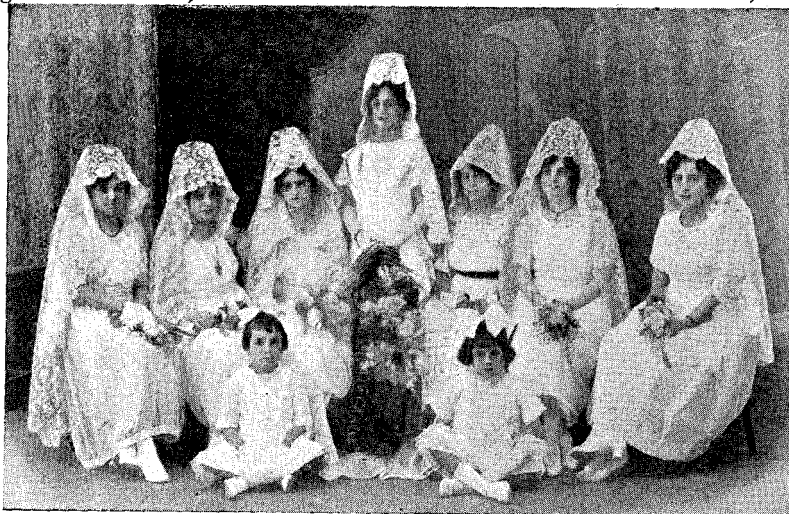
Senyorettes que composaven la Cort d'Amor

===== A l'inaugurar aquestes planes, molt ens plau dedicar un record a la gaia festa dels Jocs Florals celebrats en la darrera Festa Major.