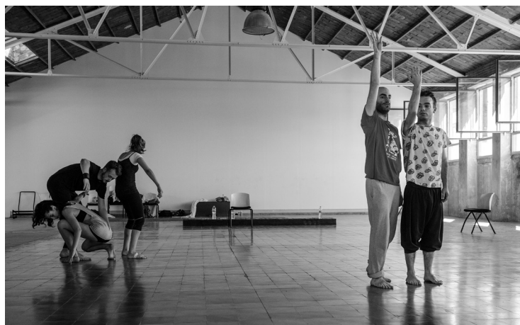
Residència d'una companyia emergent al Centre d'Arts en Moviment de Roca Umbert, 2016. Autor: Roc Pont. Roca Umbert Fàbrica de les Arts.

L'equipament es va inaugurar l'any 2016 i disposa de dues sales, una amb linòleum i parquet específic per a dansa, de 236,25 m 2 , i una altra d'oberta amb rajola hidràulica, de 492,05 m 2 .