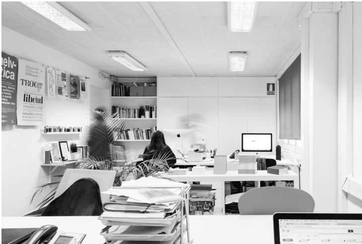
Imatge d'un espai de coworking per a empreses i emprenedors de la indústria cultural i creativa, 2016. Autor: Roc Pont. 2016. Roca Umbert Fàbrica de les Arts.

Ponències Revista del Centre d'Estudis de Granollers, 22 (2018), 7-38