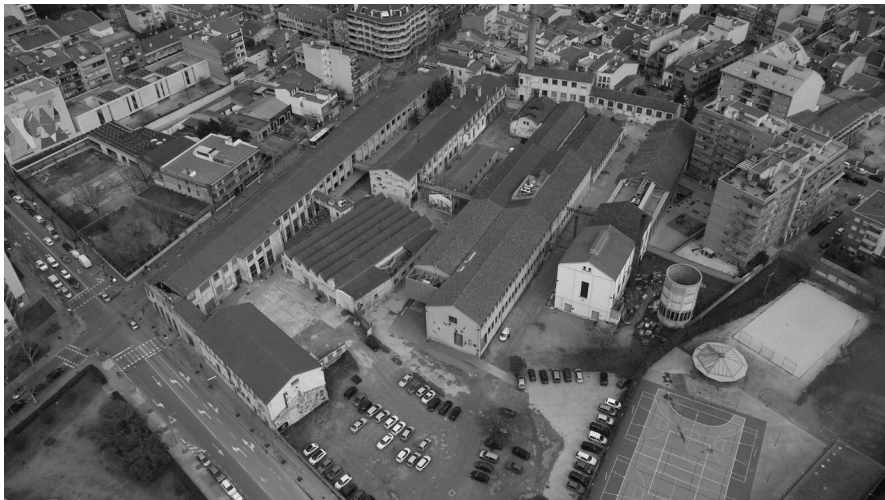
Vista aèria de la fàbrica, 2018. Autor: Roger Franch.

Ponències Revista del Centre d'Estudis de Granollers, 22 (2018), 7-38