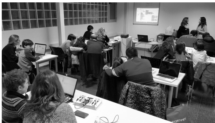
Imatge d'un taller de tecnologia, 2016. Roca Umbert Fàbrica de les Arts.