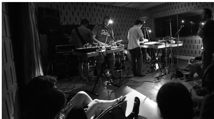
Fotografia de l'interior dels bucs d'assaig musical, 2016. 2016. Roca Umbert Fàbrica de les Arts.

Ponències Revista del Centre d'Estudis de Granollers, 22 (2018), 7-38