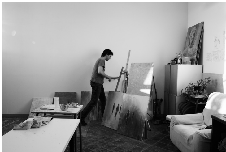
Interior d'un taller d'un artista resident de la línia de treball d'arts visuals i imatge, 2016. Autor: Roc Pont. Roca Umbert Fàbrica de les Arts.

Ponències Revista del Centre d'Estudis de Granollers, 22 (2018), 7-38