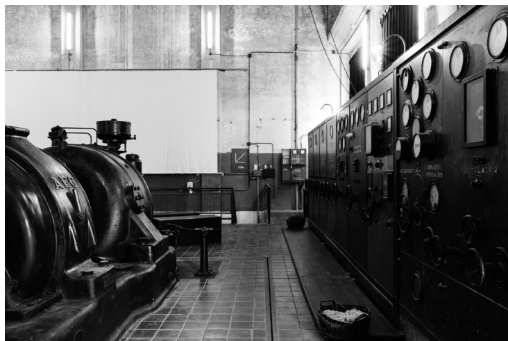
Vista de la secció de producció energètica de la Tèrmica, una museografia poc intervencionista que ajuda a fer un viatge al passat i a comprendre com funcionava i com s'hi treballava, 2016. Autor: Roc Pont. Roca Umbert Fàbrica de les Arts.

En el terreny del patrimoni industrial immaterial, entre el 2005 i el 2008 es va portar a terme, en col·laboració amb l'Arxiu Municipal de Granollers, un projecte de la memòria històrica de la fàbrica (i per extensió de la ciutat) amb