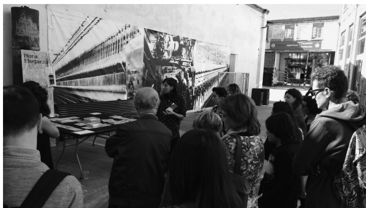
Visita comentada a les intervencions artístiques que es realitzen arreu del recinte amb motiu de la MAU (Mostra d'Art Urbà), 2016. Roca Umbert Fàbrica de les Arts.