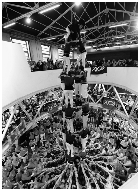
Interior de la Troca, l'equipament de la cultura popular de Roca Umbert, 2016.

La Troca afronta nous reptes, vinculats als canvis dels àmbits tradicionals de socialització (família, escola, entorn laboral) i també a les transformacions de les categories d'identificació col·lectiva (classe social, nacionalitat, religió, sector professional o família).