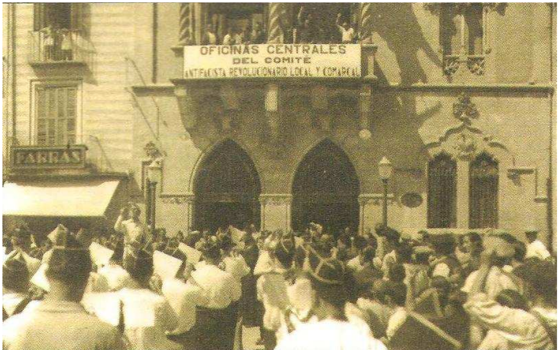
Acte polític revolucionari a l'Ajuntament de Granollers.