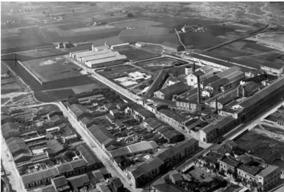
Vista general de la fàbrica de Roca Umbert.