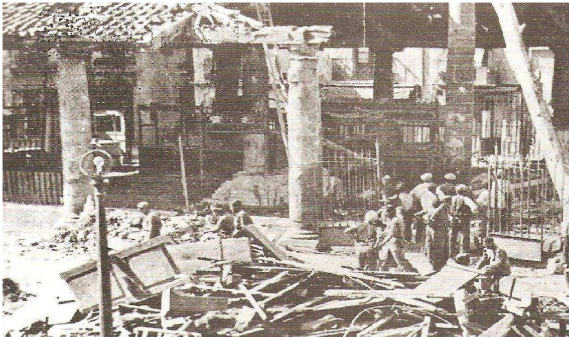
Vista de la Plaça de la Porxada després del bombardeig.

La població va tornar a rebre atacs de l'aviació, en aquest cas de l'alemanya Legió Còndor, en concret van ser realitzats per la Segona Esquadra de la II Brigada Aèria Hispana. Van haver-hi bombardejos en més d'una ocasió durant els dies 24, 25 i 26 de gener de 1939. Van acabar amb la vida de 36 persones. Les causes bèl·liques podrien ser la presència d'un fort contingent de brigadistes a la Garriga i el reagrupament de tres brigades internacionals. A això cal sumar que la població que fugia provocava incendis, perquè quan arribessin els nacionals no trobessin res que els fos útil.