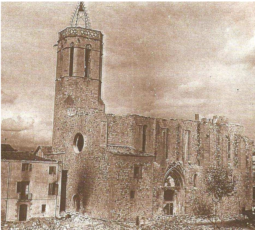
Església de Sant Esteve després de ser incendiada i saquejada.

El Comitè i l'Ajuntament venien a ser el mateix i, malgrat que legalment, en compliment d'un decret de la Generalitat, el Comitè es va dissoldre el 9 d'octubre, a la pràctica és ell, amb la força que li dóna haver pres possessió de l'Ajuntament, el gran protagonista i responsable de tots els esdeveniments que es produïren al llarg de la guerra.