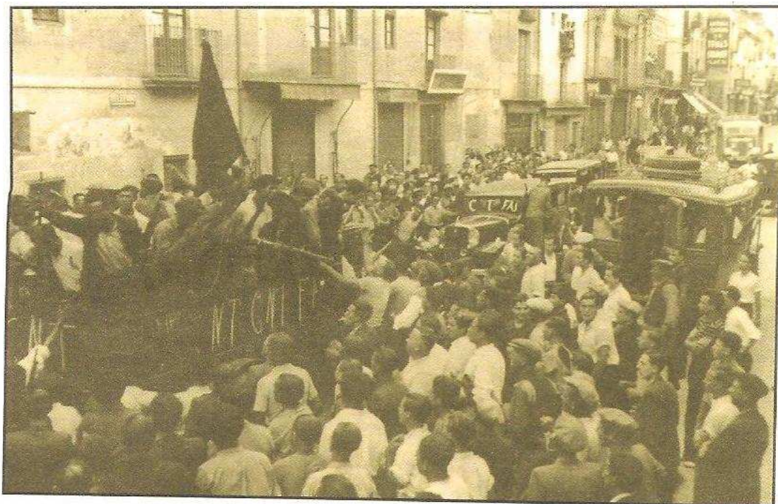
Integrants de la CNT-FAI pels carrers de Granollers.