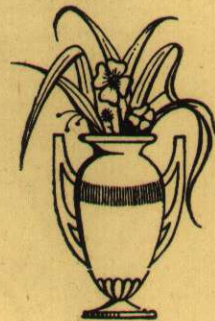
La seva festa 20 de Gener

D'heroica virtut model, soldat de l'Etern Senyor Oïu al Barri fidel que us invoca per Patró.