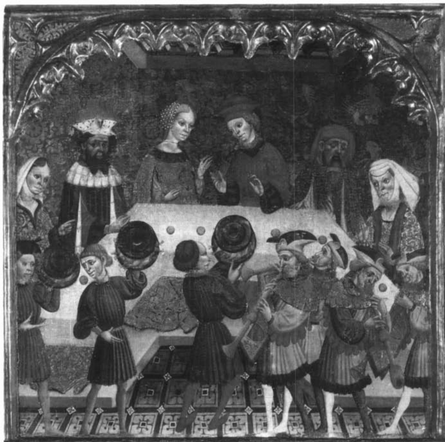
Representació de les noces de sant Julià i santa Basilisa, seguint el model de l'època, en un dels compartiments del retaule del mestre de Santa Basilisa, segle xv.

Així, per garantir les fonts d'ingressos basades en les rendes, sobre les quals es fonamentava el