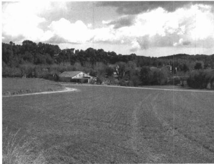
El mas Beltran de Corró d'Amunt, antic mas Torrent, havia estat propietat dels Tagamanent.

Durant els temps baixmedievals els Tagamanent, igual que altres senyors, eren majoritàriament perceptors de rendes i, per tant, orientaven els seus interessos cap a l'establiment de famílies pageses en els seus dominis per obtenir-ne la renda. Sabem també que van fer algunes compres i vendes, encara que en coneixem més escriptures de compra que no pas de venda. Ben mirat, aquesta activitat responia a la mateixa lògica dels establiments: