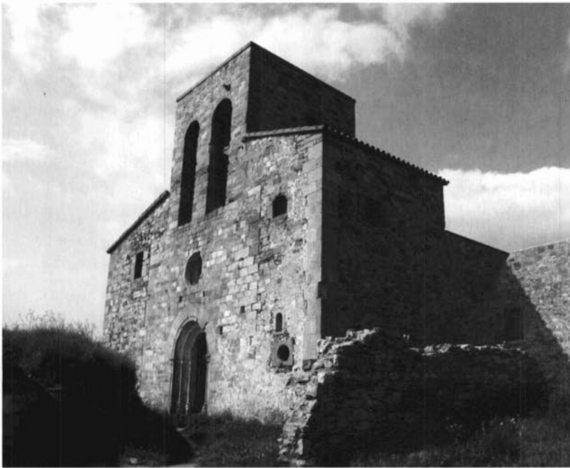
Església del castell de Tagamanent. (Fotografia: Pere Cornellas, 2004)

conjuntura econòmica i de la consolidació d'un sistema de relacions socials agràries (els establiments emfitèutics) que els allunyava de la terra. Entre els llinatges de senyors de castells pròpiament vallesans, els Tagamanent, amb possessions esteses cap a migjorn de la muntanya de Tagamanent, pel curs del Congost i la riera de Cànoves, representaven una noblesa mitjana, els membres de la qual portaven sovint el títol de miles en els documents d'establiment. En aquest sentit, és interessant assenyalar, per les precisions que aporta, l'establiment realitzat el 2 de febrer de 1301 per Elisenda, vídua de Guillem de Tagamanent, i pel seu fill Guillem 5 i la seva dona Elisenda de Bell-lloc, que van establir Astruc Pelfort i la seva dona en el mas de Fàbregues, de la parròquia de Santa Eulàlia de