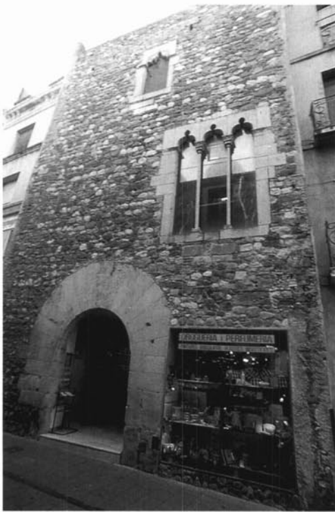
Casal dels Tagamanent a Granollers, del segle xv.

la família d'alguns membres de la mainada del senyor, que estarien sota la tutela del testador. Aquestes pràctiques mostren la solidaritat interfamiliar existent entre els nobles.