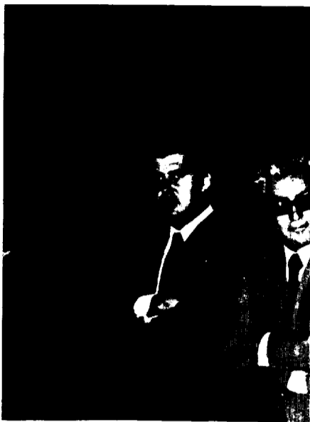
nto de su intervención oral