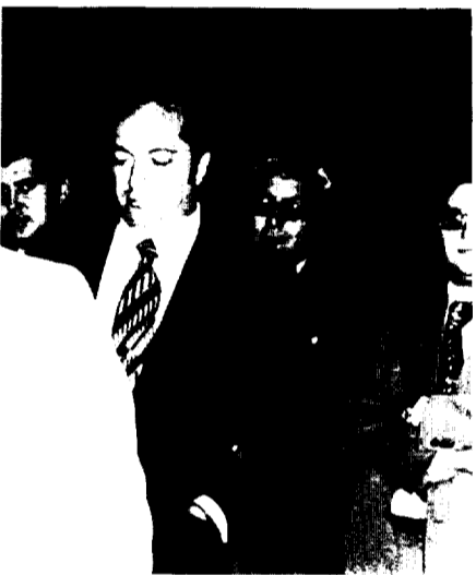
iso de la palabra

tienen por qué dividir a una afición, sino todo lo contrario, unirla en apoyo de ambos clubs representativos de Granollers. También anunció el señor Ventura la inauguración oficial del pabellón metálico construido a espaldas del Municipal de Deportes, que da cabida a tres pistas de balonmano y otras tantas de baloncesto.