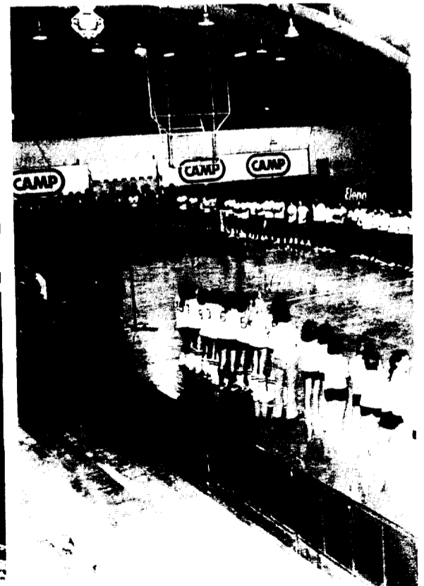
Una perspectiva del Pabellón de Deportes de Granollers