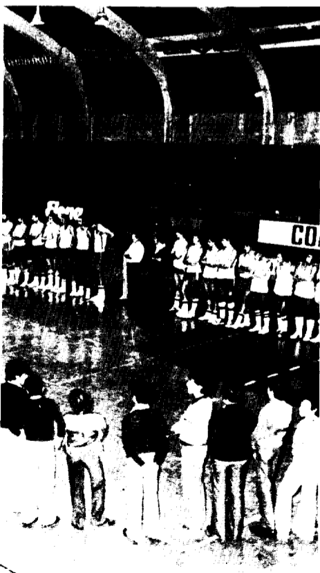
en el acto de presenta-