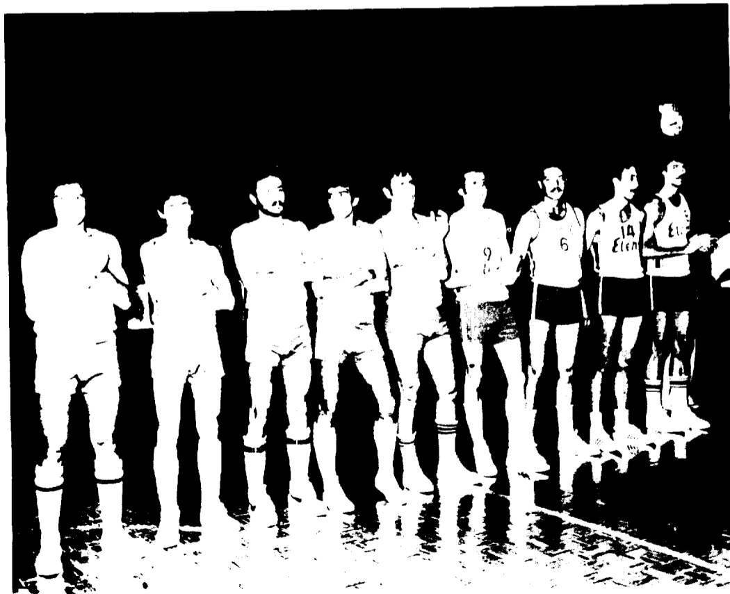
El conjunto del Baloncesto Granollers, que defenderá este año los colores locales