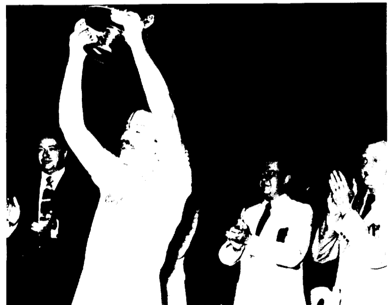
Aperador con el Trofeo ZURICH conquistado por el B. M. Granollers