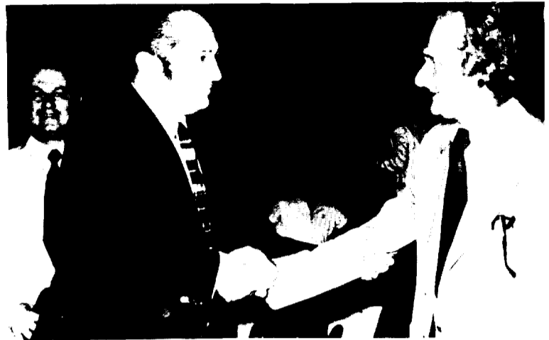
Los presidentes de los dos equipos se saludan