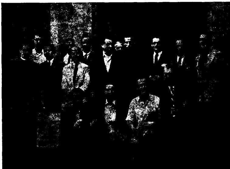
Los representantes de Granollers junto a los dirigentes nacionales y diocesanos

«La Iglesia es la que saca del Evangelio las doctrinas que pueden resolver completamente el conflicto social, o por lo menos hacerlo más suave, quitándole toda aspereza, ella procura no sólo iluminar la inteligencia, sino también regir la vida y las costumbres de cada uno conforme a sus preceptos, ella promueve la mejora del estado de los proletarios con muchas instituciones «utilísimas» (León XIII en la «Rerum Novarum»).