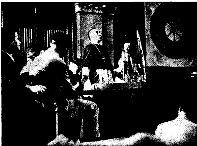
El Excmo. y Rdmo. Sr. Obispo de la Diócesis dirigiendo la palabra a los concurrentes a la última Asamblea de la H. O. A. C. en Barcelona

Como complemento de la información gráfica que en esta misma página se publica y del reportaje, brevísimo, de la siguiente, insertamos a continuación algunas frases e ideas luminosas de la Jerarquía eclesiástica y de los dirigentes de la Hermandad, para que al mismo tiempo contribuyan a fijar en la conciencia de quien esto lea algunos de los aspectos más interesantes de este movimiento obrero.