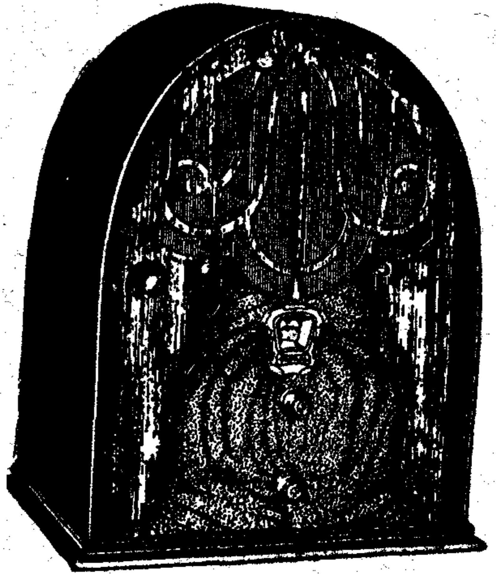
Model 40, de 5 vàlvules

Model 40 —Amb circuit Neutrodí ultra-modern a base de les vàlvules Multi-mu i Pentodo , dotat de tots els perfeccionaments i equipat amb el famós altaveu dinàmic TCA , amb 98 % de puresa de to.