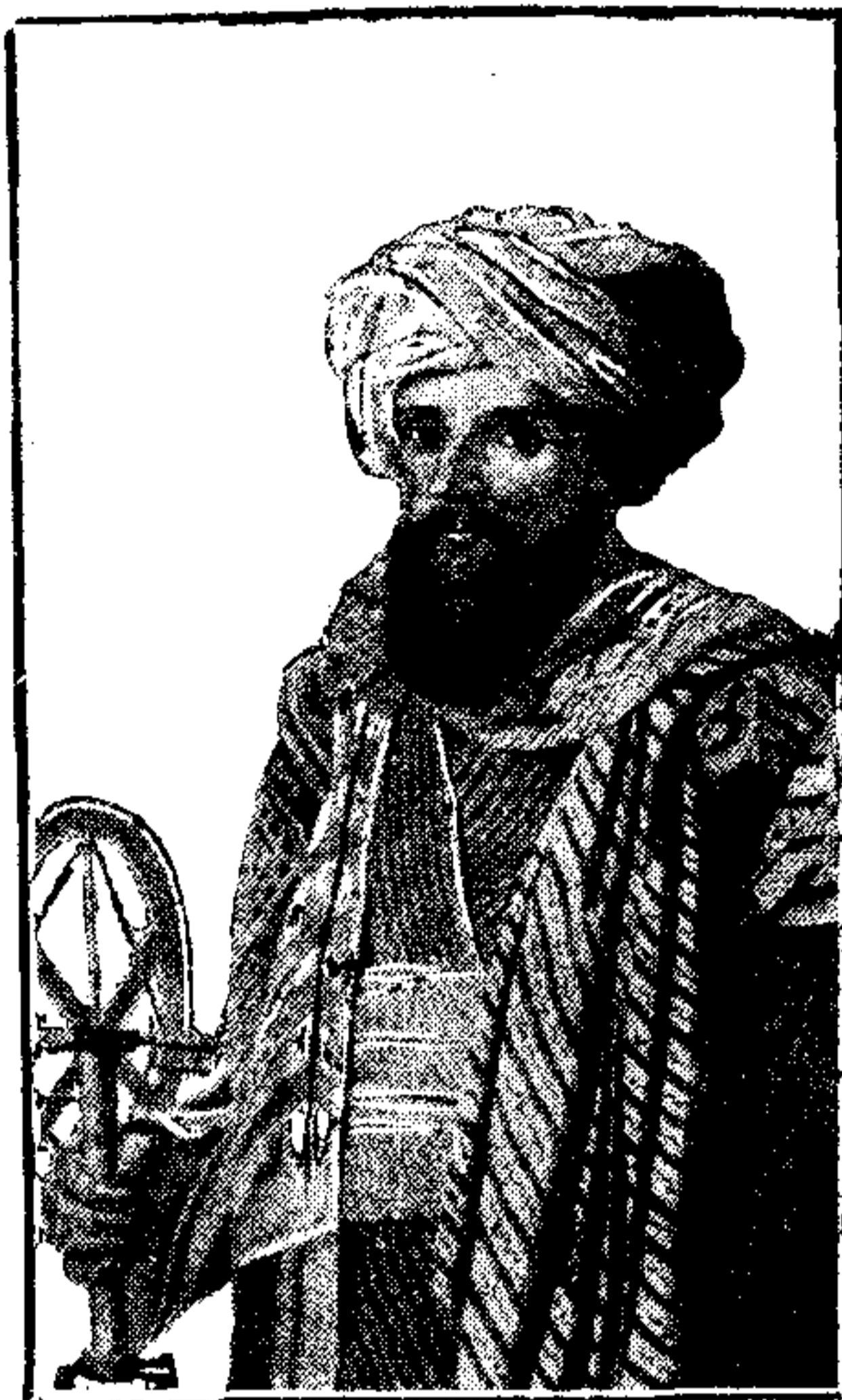
ALÍ-BEY EL ABBASSI

L'aspecte de Ramanié, com el de totes les viles interiors del baix Egipte, no té res d'agradable. Les habitacions estan establertes en petits pujols d'una terra gairebé negra, i construïdes, per falta de pedres, amb maons mal cuits, fets amb la mateixa terra negra, els quals, no emblanquinats, donen a aquesta vila un aire llòbreg. Hom hi remarca també un barri únicament compost de colomars, en forma de pa de sucre o de cúpula parabòlica, el conjunt dels quals dóna a Ramanié un aspecte original.