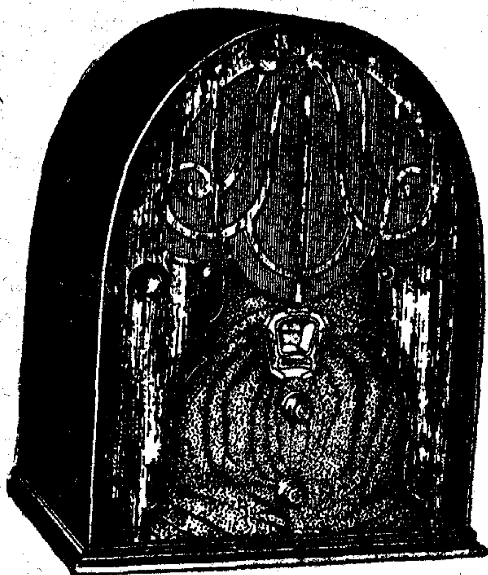
Model 40, de 5 vàlvules

Model 40 —Amb circuit Neutrodí ultra-modern a base de les vàlvules Multi-mu i Pentodo , dotat de tots els perfeccionaments i equipat amb el famós altaveu dinàmic TCA , amb 98 % de puresa de to.