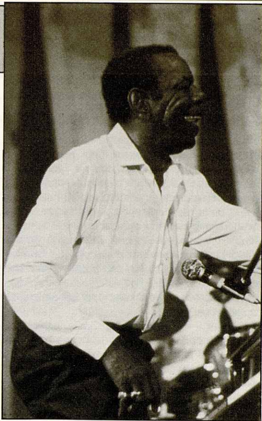
"Champion" Jack Dupree

Si tot això queda més o menys clar, hem de dir que enguany, a Terrassa s'hi ha anat a escoltar