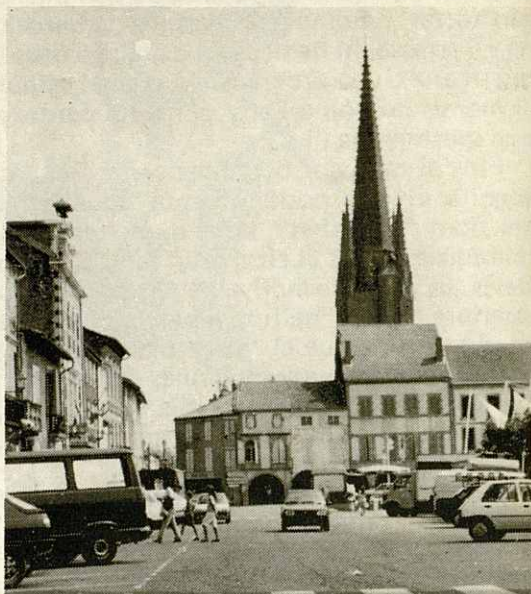
Plaça de Marciac, amb la seva típica Església.

Hay que decir que en Marciac viene gente de toda Francia y Europa a vibrar y a participar con el buen jazz. Este año se de-