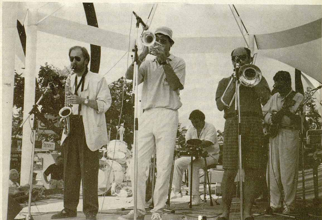
TING A LING, Grup oficial de Marciac, al pòdium de la plaça. (14 d'agost 1989)

ORIGINAL PRAGUE SYNCOPATED ORCHESTRA (Checoslovacos). Una gran orquesta de 16 integrantes, más 3 cantantes. Jazz de corte, o estilo años 25 de los salones blancos de la época. Junto con