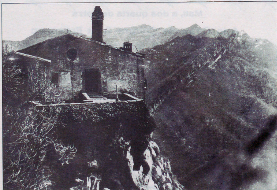
Ermita de Bellmunt, al fons la serralada de Puigsacalm, on Jacint Verdaguer s'inspirà per la lletra de "L'Emigrant"