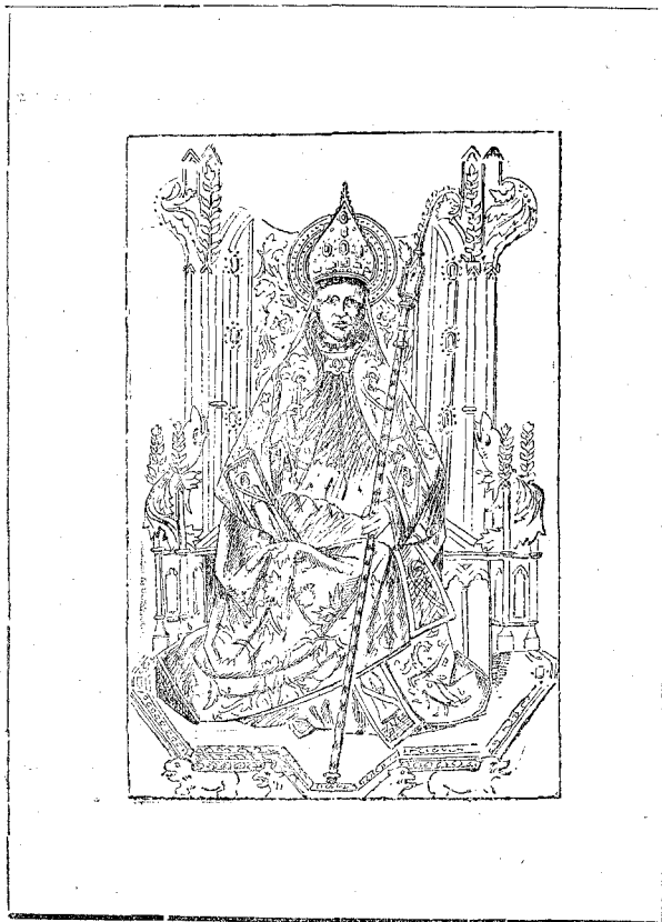
Fragment de un retaule dedicat á Sant Victoriá, Abat