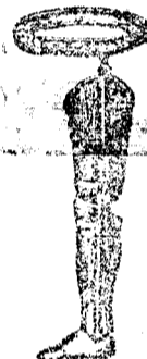
Pierna artificial, amputacion 3 cents. de la rodilla

Especialidad en bragueritos de goma para la curacion de los tiernos infantes.