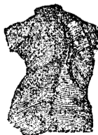
Desviacion de la columna vertebral 2.º grado.