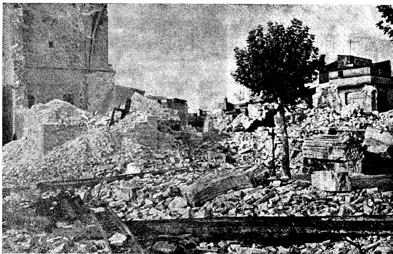
Un aspecto del derribo de la iglesia por el ramo de la construcción.

error, destrozando sus efectos. Hay que eliminar las causas que los motivan. Sobre el frontispicio de este convento están emplazadas las andamiadas. Unas mujeres, al parecer novicias monjales, ejercían el cargo de educadoras e instructoras de la niñez. ¡Educadoras e