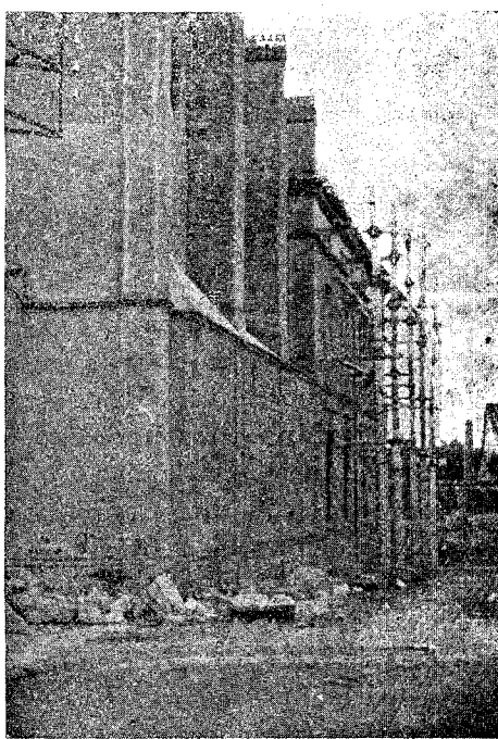
Lo que fué convento serán magníficas escuelas

Obras como ésta quedan perennes; honran las colectividades que las realizan; máximo como ésta que tuvo efecto