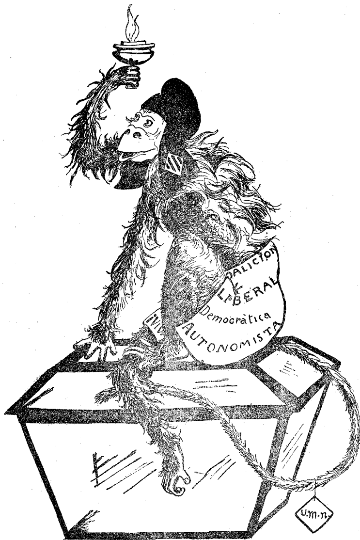
«Aunque la mona se vista de seda mona se queda»