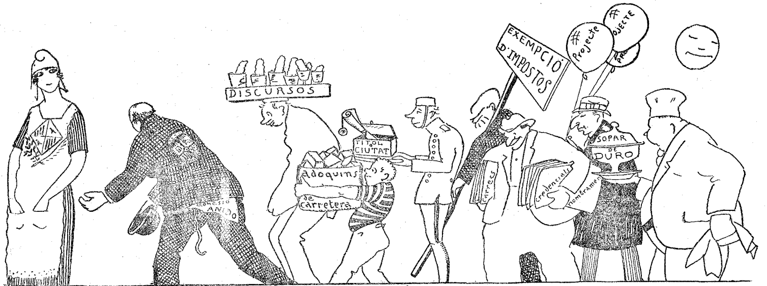
El candidat.—Del teu cor tant se m'en dona, tonta! Lo qu'et busco es el cos... electoral.