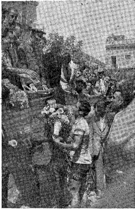
MURCIA, vencedor de la gran Carrera Ciclista celebrada el Domingo de Fiesta Mayor, es obsequiado con un ramo de flores por unas señoritas de nuestra ciudad, después de la carrera.