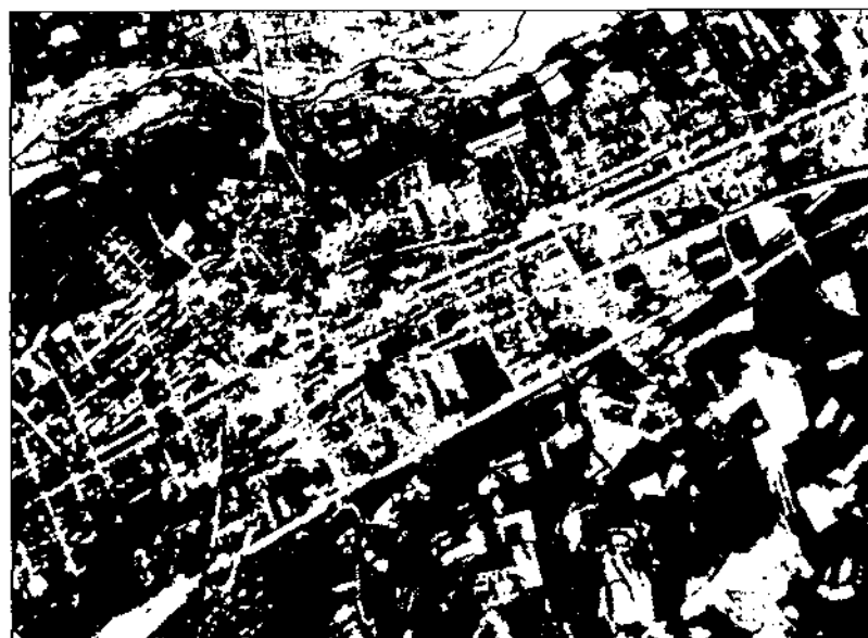
Bombardeig del 31 de maig de 1938. Un altre moment de l'impacte de les bombes.

França—; lliurament de les fotografies fetes des dels avions italians mentre les bombes esclataven a dins de Granollers, documents que poguérem tenir a la vista i estudiar amb Lluís Tintó. I sobretot, acabar d'esbrinar definitivament —si hom pot encara— el perquè de tanta negligència per part dels aviadors italians (ells reconeixen que no van encertar l'objectiu), i el perquè de tanta destrucció —morts, ferits, gran quantitat d'immobles destruïts— en l'atac que colpejà Granollers, un dimarts, 31 de maig de 1938, que començà tranquil, però que es tenyí ràpidament de sang i que hauria de servir una i cent vegades de reflexió sobre la brutalitat humana.