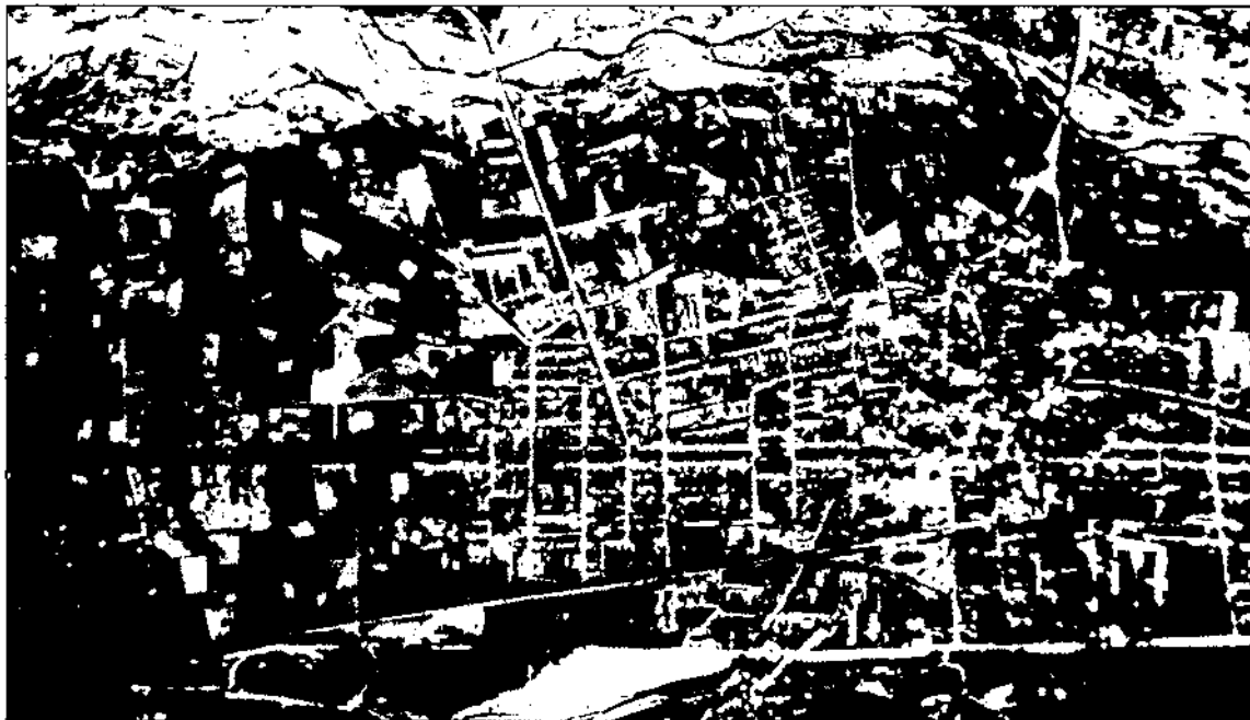
Fotografia aèria de Granollers que mostra els impactes de les primeres bombes llançades pels avions italians.

En el número 319 de la Revista «Historia y Vida», del mes d'octubre de 1994, va aparèixer un article signat per J.L. Infiesta i Josep Coll que portava per títol «Una aportación al estudio del bombardeo de Granollers del 31 de mayo de 1938».