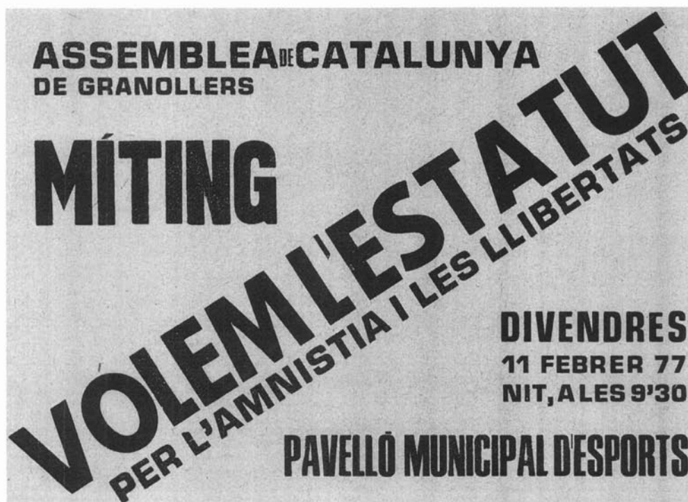
Cartell anunciador del míting "Volem l'Estatut!" de l'Assemblea de Catalunya de Granollers l'11 de febrer de 1977.

"Per què l'Estatut de 1932?". Aquesta iniciativa va tenir repercussió a Granollers i a d'altres localitats de la comarca.