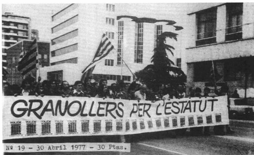
Manifestació per l'Estatut a Granollers el dia de Sant Jordi de 1977. La revista del Vallès Oriental Comarca al Dia s'adherí públicament a la campanya dedicant-li el número del 30 d'abril. (Comarca al Dia núm. 19).