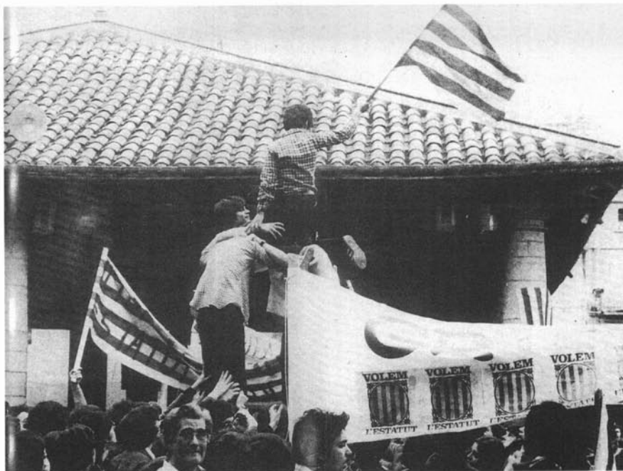
En la campanya per a l'Estatut, l'Assemblea de Catalunya va promoure pel dia de Sant Jordi la convocatòria de "Tots davant els Ajuntaments".