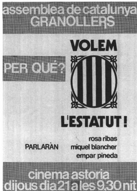
Cartell anunciador del míting "Per què volem l'Estatut" de l'Assemblea de Catalunya de Granollers el 21 d'abril de 1977 (HMG).

Una diligència de la Brigada d'Investigació Social de la Policia Armada compatibilitzava, a les 22.15 hores de la nit d'aquell