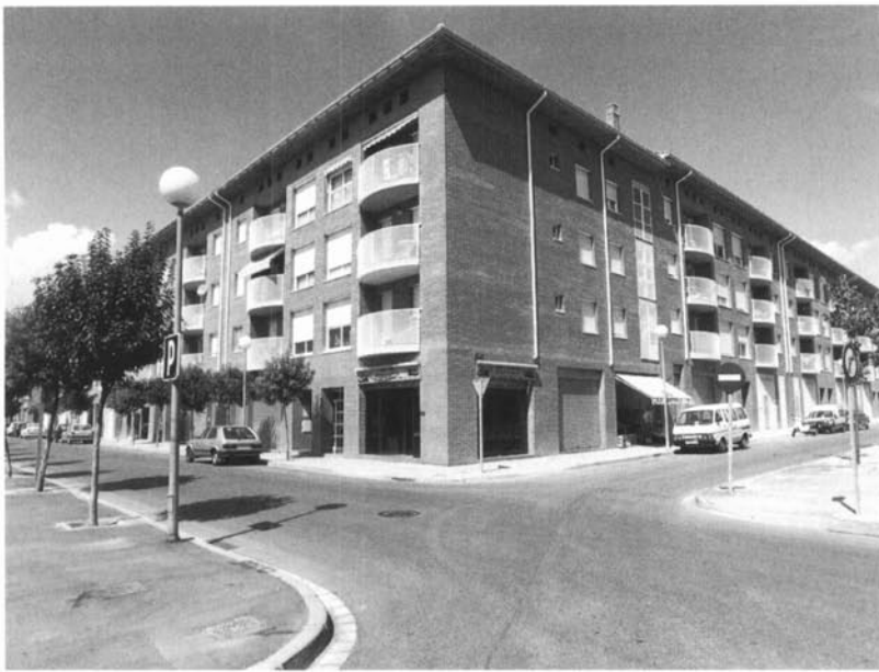
Un exemple del fort creixement residencial d'alguns nuclis: el barri de Tres Torres.