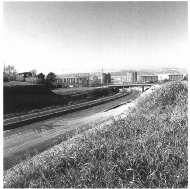
El creixement urbanístic de Granollers està perfilant de manera important la fisonomia actual del municipi sobre la base de l'increment del parc d'habitatges i de la construcció de noves vies de comunicació. Vista de l'entrada de Granollers per la ronda nord.