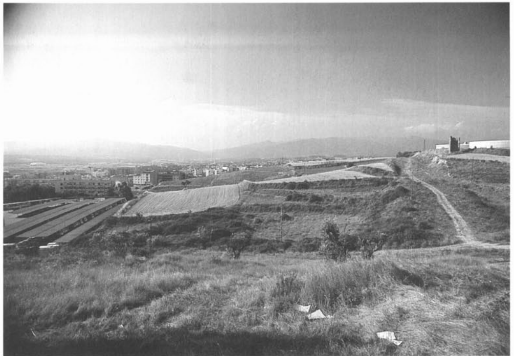
Zona de la torre Pinós.

A més a més, s'observa que tots els boscos es localitzen al llarg