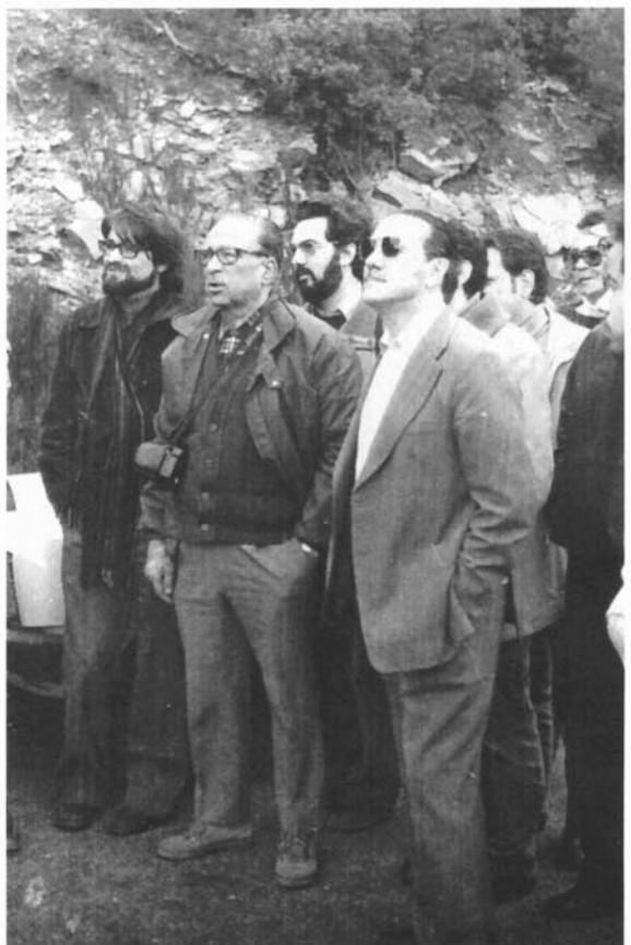
Excursió al Montseny amb els professors del Departament de Geografia de la UB, 1980.