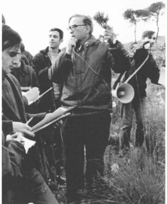
Excursió de pràctiques al Garraf, març de 1968.