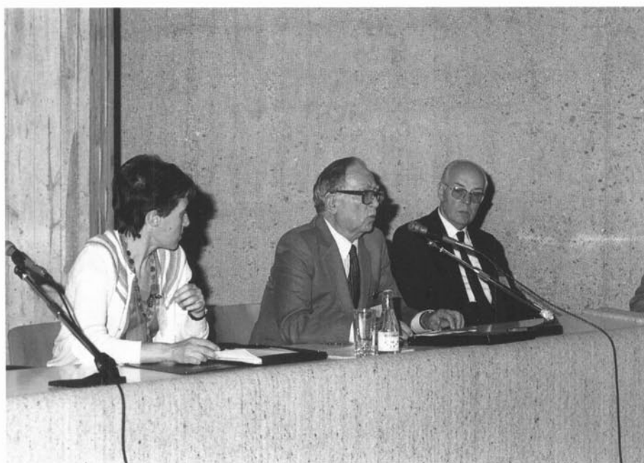
XXXIII Assemblea Intercomarcal d'Estudiosos al Museu de Granollers, els dies 17 i 18 d'octubre de 1987.

Geni i figura, Salvador Llobet morí treballant i abandonà la universitat sense acceptar l'homenatge que aquesta institució li oferia. Auster, fins i tot en els elogis, ens ha deixat una obra sòlida i àmplia que caldria aprofundir encara més.