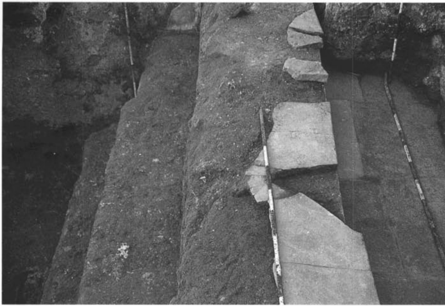
Graons d'un dels frigidaria localitzats a les excavacions d'urgència de l'estiu de 1980, en construir-se l'edifici Vila Oberta del carrer de Sant Jaume. Es tracta del conjunt de construccions romanes més luxoses localitzades a Granollers.