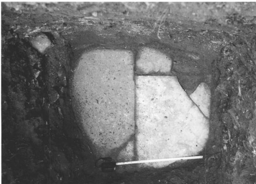
Continuació del paviment d' opus sectile , en un sondeig fet a sis metres de distància al sud del mur de l'antiga fàbrica, que confirma la continuïtat constructiva d'aquest complex de banys per sota de les obres de l'edifici Vila Oberta del carrer de Sant Jaume.

La zona d'enterraments d'època romana es localitza dins l'àrea d'un arc de noranta graus que va d'oest a nord. Aquesta àrea de necròpolis té el límit sud al carrer de Sant Jaume, on hi ha notícia de la troballa d'un important sepulcre visigòtic (ESTRADA, 1970), i a la zona de l'antiga fàbrica de Can Trullàs, on, els anys cinquanta, es van localitzar restes d'enterraments d'incineració (ESTRADA, VILLARONGA, 1967), i l'important complex funerari estudiat per Montserrat Tenas (TENAS, 1996), a partir de les excavacions realitzades el novembre de 1990. La zona s'estén per l'àrea compresa entre el carrer de Sant Josep; els carrers de Pompeu Fabra i Verge de Núria (enterraments d'inhumació) (vegeu nota 1); el carrer Catalunya, on van localitzar-se més enterraments en tegulae (ARRIZABALAGA, PARDO, SADURNÍ, 1984); el carrer de Torres i Bages, amb les importants troballes d'enterraments en tegulae documentades per Josep Estrada davant de l'antic escorxador (Teatre de Granollers) (ESTRADA, VILLARONGA, 1967), i el carrer de Corró, on han estat localitzades nombroses restes disperses d'enterraments d'inhumació (vegeu nota 1).