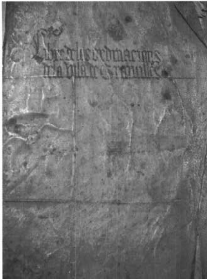
Portada del Llibre d'ordinacions de la vila de Granollers , segle XV. (Hemeroteca Municipal Josep Móra de Granollers)

«Ordinació sobre lo quarta de gra». Llibre d'ordinacions de la vila de Granollers , segle XV. (Hemeroteca Municipal Josep Móra de Granollers)