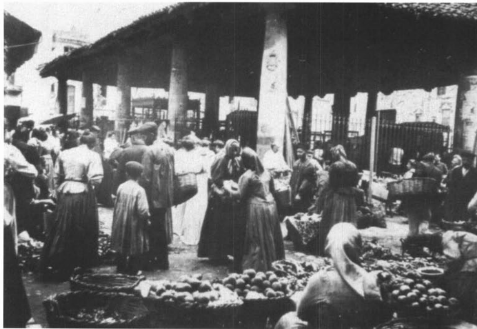
Mercat de Granollers, plaça de la Porxada.

És evident que, com dèiem, les mesures preses per les autoritats municipals respecte del mercat tenien un triple objectiu: aconseguir ingressos mitjançant les impositcions, garantir el proveïment i protegir la producció local de la competència forana. Quant als ingressos fiscals, per exemple, els impostos que gravaven la venda del vi a la menuda estaven fixats per les autoritats municipals en el quart, és a dir, de cada 4 sous el municipi se'n quedava 1 i el venedor en retenia 3, o dit d'una altra manera, les autoritats municipals retenien una quarta part del preu del vi, mentre que el venedor es quedava amb tres quartes parts. Quant a la protecció de la producció local enfront de la competència forana, s'aconseguia mitjançant el pagament d'un dret d'entrada que es percebia per quantitat de producte entrat, fos qui fos el mercader importador. «Que negun home de