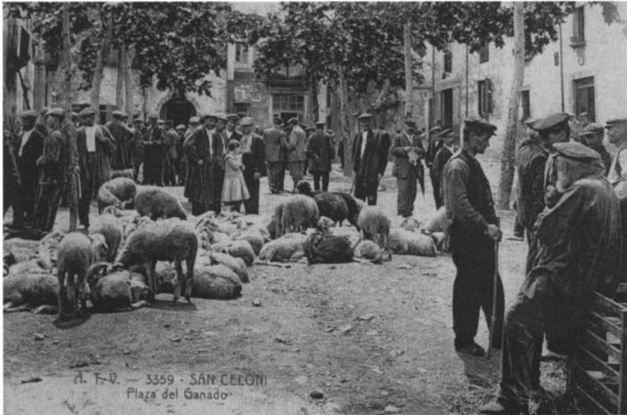
Plaça del Bestiar de Sant Celoni, entorn de l'any 1908.

facultat de vendre vi si tenien taverna; amb tot, els jurats i el mostassaf tenien el dret de tastar el vi dels hostals per tal de comprovar-ne la qualitat. En cas que es vengués un vi adulterat o de qualitat inferior a la deguda, s'imposaria als infractors una multa de 20 lliures. Una disposició de Granollers de l'any 1437 era clarament favorable a l'activitat del petit comerciant: « Neguna persona així sortir sabater parayre texidor com altre qualsevol ofici qui tinguen macip o macips que lo senyor nols gos vendre pa ni vi ans lagen a comprar a la flaquera e taberna a menut sots lo bant demunt dit (XX sous). » 26