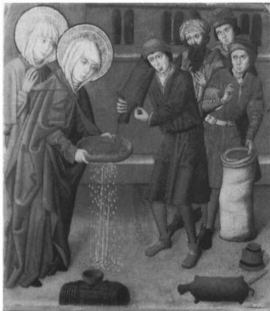
Escena del transvasament del gra per un sedàs. Compartiment del retaule de les santes Justa i Rufina de Lliçà d'Amunt. Finals del segle XV, atribuït a Rafael Vergós. (Museu Diocesà de Barcelona. Fotografia: Rosa Ribes)

no gos tallar carn fins que sia pesada per lo impositoner sots bant de V sous». 6