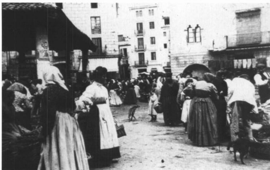
Mercat de Granollers, plaça del Blat.

L'arrendament, en definitiva, desviava cap a les bosses privades una part important dels diners que, mitjançant les impositcions, s'extreien dels veïns de la vila. Els arrendadors o compradors obtenien, naturalment, un guany que consistia en la diferència entre els diners recaptats i el preu que havien pagat per la compra o l'arrendament de la impositció. 12 Precisament per garantir els drets dels compradors o arrendadors les ordinacions de Granollers contenen una norma referida a la clàusula d'evicció: «Item que la vila fa evicció a tots los comprados de las impositcions qui en cas que per sobergaria o per falta de justicia non podran haver que la dita vila lo y prenga en comta manant lo fet tro aferme de dret.» 13