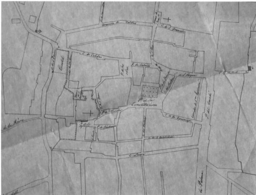
Detall: centre de la ciutat.