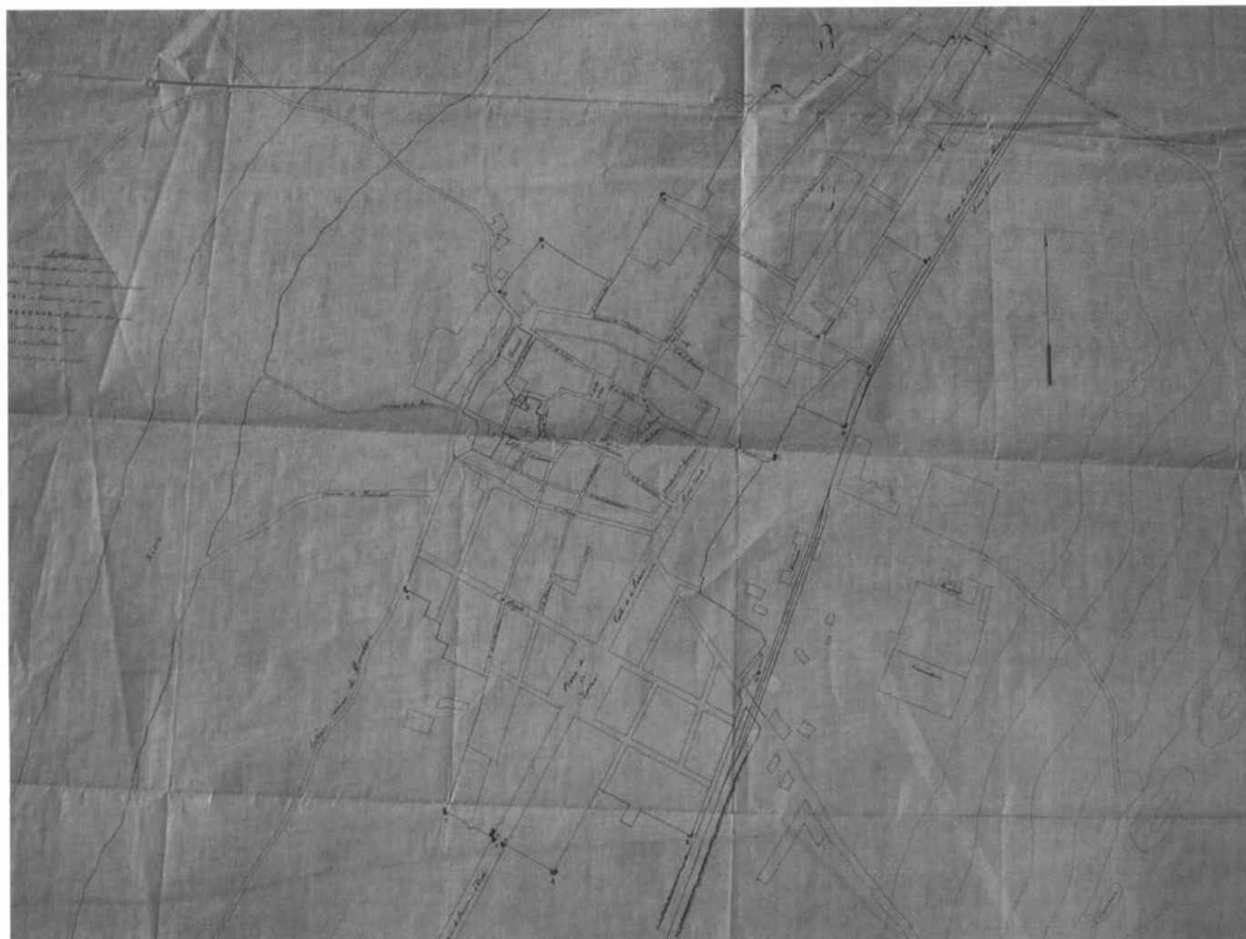
Plànol de la muralla carlina de Granollers, 1875.