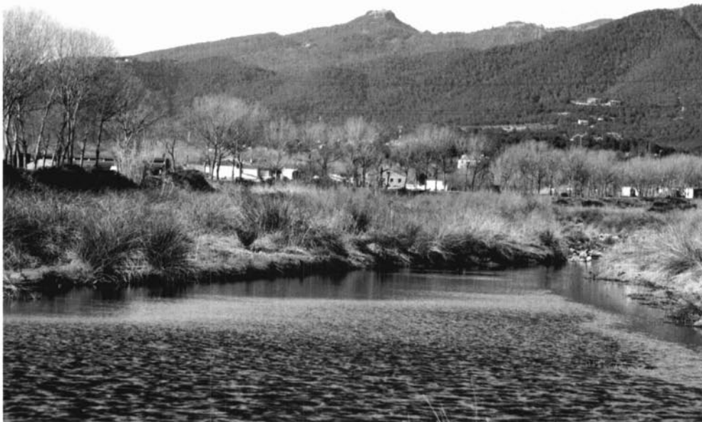
El castell de Tagamanent dominant la vall del Congost, amb el pla de Llerona en primer terme.

pagaria la suma de 400 unces d'or de Barcelona. Va ser en aquest mateix segle que el nom de Tagamanent, adoptat pels cavallers del castell, apareix documentat. És possible que la família Tagamanent encarregada de la guarda de l'esmentat castell procedís de la parròquia de Sant Cristòfol de la Castanya, a llevant del terme del castell, on hi ha notícia documental que van tenir dominis fins a la baixa edat mitjana. 1 Sembla que un dels primers senyors castllans coneguts que va portar el nom de Tagamanent va ser Berenguer Sanç (m. v. 1095), casat amb una dona de nom Guisla. Ambdós cònjuges van encapçalar l'arbre genealògic familiar que coneixem. 2 Pel que fa al segle següent, hi ha notícia d'un Bernat de Tagamanent, que en el seu testament del 1160 va fer hereu