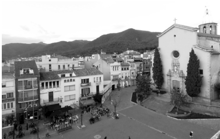
Capvespre de primavera a la Garriga, amb el Montseny de fons. Fotografia: Martí Oliveras, 5 abril 2016.

dels enquestats van respondre negativament i un 10 % no ho sabien o no contestaven.