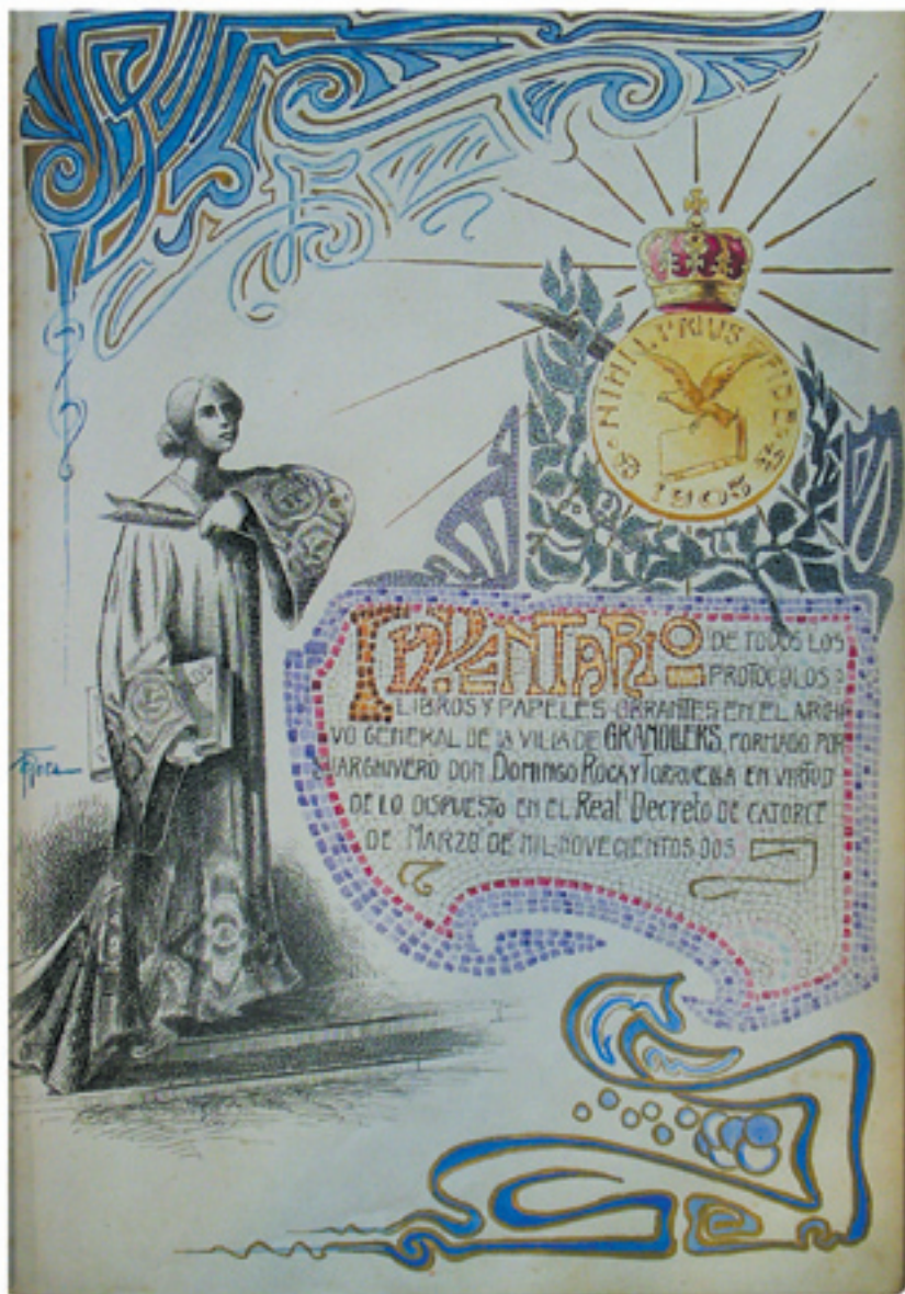
Primera pàgina del «Inventario».