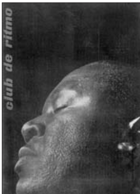
Portades de la publicació Club de Ritmo de Granollers, núm. 16 (agost 1947), 116 (desembre 1955), 144 (abril 1958) i 207-208 (juliol-agost 1963).