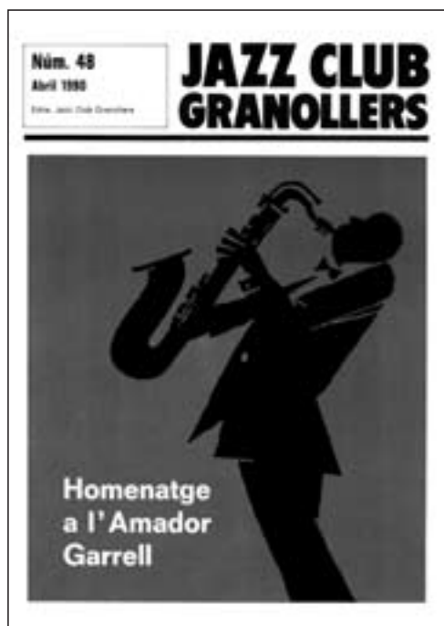
Portades de la revista Jazz Club Granollers , núm. 2 (gener 1984), 23 (maig-juny 1986), 32 (juliol 1987) i 48 (abril 1990).