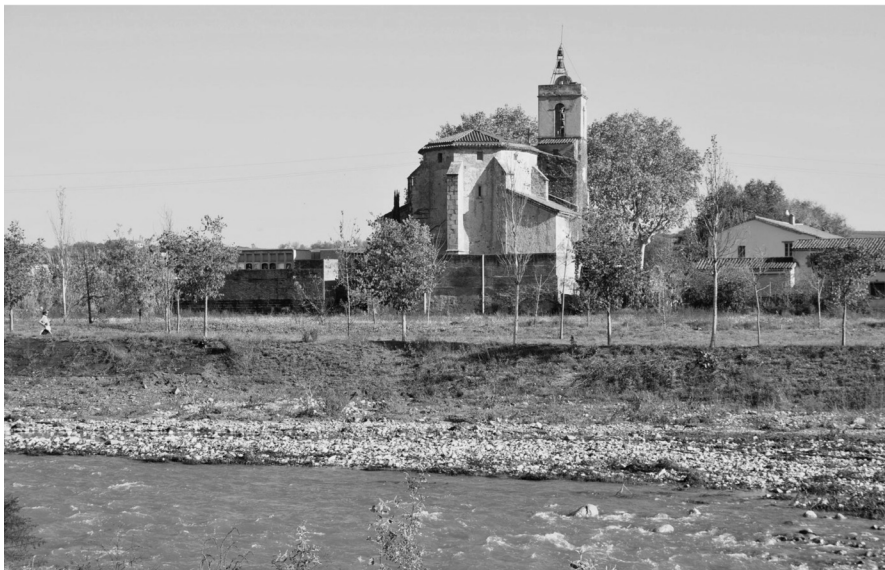
Vista del tram de mur desendegat a l'alçada de l'església de Palou.

retirar estructures hidràuliques en desús, a fi d'eliminar obstacles i facilitar el desplaçament de la fauna aquàtica, i també evitar l'acumulació de residus. Per primera vegada, en el terme municipal de Granollers es va construir una escala de peixos per facilitar la superació de desnivells importants, com és el col·lector d'aigües residuals que travessa el riu Congost i que està situat a uns 200 metres del pont de la carretera Interpolar. Ara bé, l'actuació més emblemàtica va ser la naturalització d'un tram de 603 metres del mur de formigó de la canalització del riu, d'acord amb un projecte hidrogeomorfològic aprovat per l'Agència Catalana de l'Aigua. Es va deixar la base del mur fins a una alçada aproximada d'un metre, es va protegir la base amb escullera de roca i es va recobrir amb terres; els marges van quedar estabilitzats amb tècniques de bioenginyeria. Per tal de garantir la seguretat en cas d'avingudes, es van fer créixer unes motes al passeig fluvial. Aquest projecte tenia per objectiu millorar la connectivitat transversal entre la zona agrària del pla de Palou i el riu Congost per, d'aquesta manera, esdevenir un corredor biològic. L'actuació de desendegament va ser pionera a la conca del Besòs i a Catalunya.