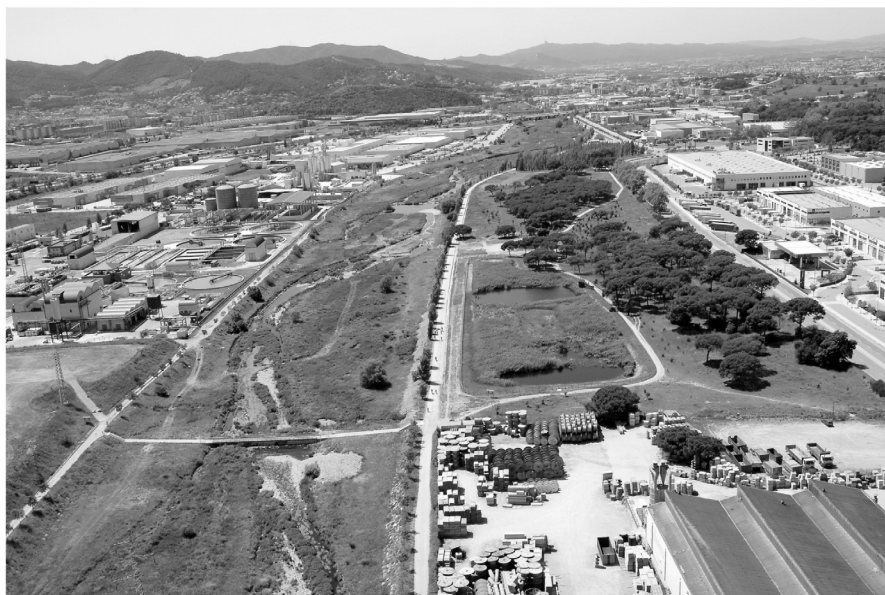
Vista aèria del riu Congost i l'espai natural de Can Cabanyes amb l'aiguamoll.

El Pla d'ordenació urbanística municipal de Granollers vigent des de 2007 preveu traslladar les indústries que ocupen els terrenys situats al nord de Can Cabanyes cap a altres espais. L'aprovació definitiva del Pla parcial del sector urbanitzable 112 permetrà l'alliberament dels terrenys situats entre Can Cabanyes, la carretera de Montmeló, el riu Congost i la carretera Interpolar. Aquest fet possibilitarà incrementar substancialment la superfície d'espai verd de Can Cabanyes. En el moment que es concreti i es desenvolupi serà l'oportunitat per plantejar la construcció d'un nou aiguamoll a fi d'incrementar la capacitat d'aigua residual tractada i posteriorment reutilitzable, potenciar la biodiversitat de l'espai fluvial i l'educació ambiental.