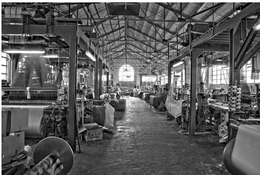
Interior de la fàbrica Viuda Sauquet del carrer Orient, 35 de Granollers, l'any 2012.