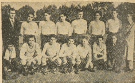
Equipo de fútbol actual

Los Olímpicos merecían la victoria por mejor juego y brío que pusieron en la lucha, pero como hemos dicho anteriormente, el árbitro se inclinó por el equipo local cuando el resultado era de 2-0 a favor de los olímpicos a 15 minutos del final. Los goles fueron conseguidos