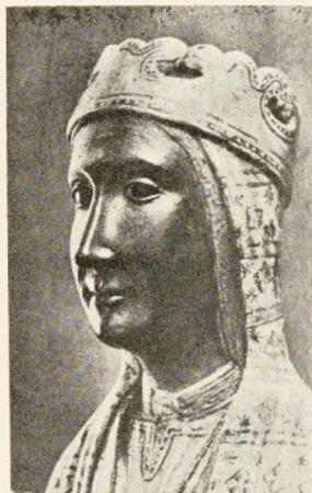
La "Moreneta", Patrona de la Agrupación

Pero, además, el deporte supone un esfuerzo corporal que proporciona una acusada personalidad al que lo practica por la disciplina que debe imponerse, y por la misma lucha que fortalece su voluntad y le obliga a un domi-