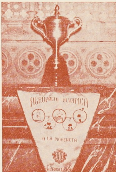
El trofeo y banderín de la Agrupación en Montserrat

También se está en contacto con varios equipos que esperan nuestra visita.