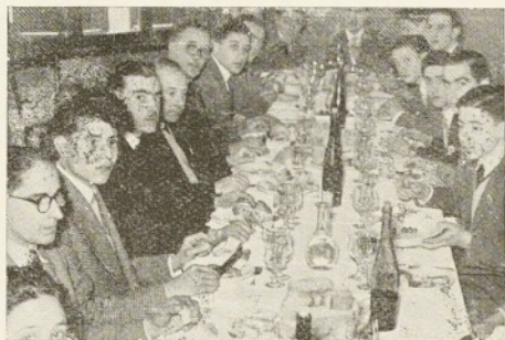
Primer Aniversario presidido por el Excmo. Sr. Alcalde y Presidente del C. C.

El Boletín n.º 50, anticiparemos que se compondrá de unas 40 páginas, todas a 2 colores. Habrá una página con el historial de cada año, comentando lo más sobresaliente de la Agrupación durante dicho tiempo, así como diferentes páginas dedicadas a información, comentarios, etc.