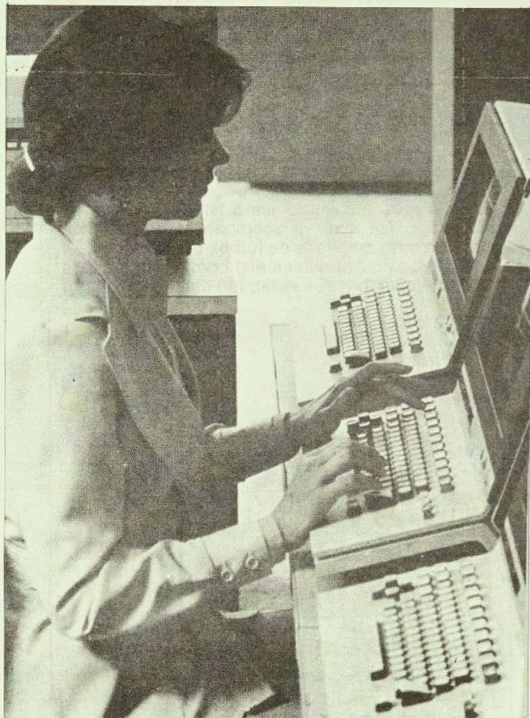
Redacció de L'ESMOLL

La disponibilitat és immediata ja que una vegada hem pres imatges, podem rebobinar la cinta i visionar-la d'immediat; d'altra banda al cinema per a visionar-la hem d'esperar com a mínim una setmana i sense cap opció de tornar a filmar a sobre la mateixa pel.lícula, mentre que al vídeo això sí que és possible.