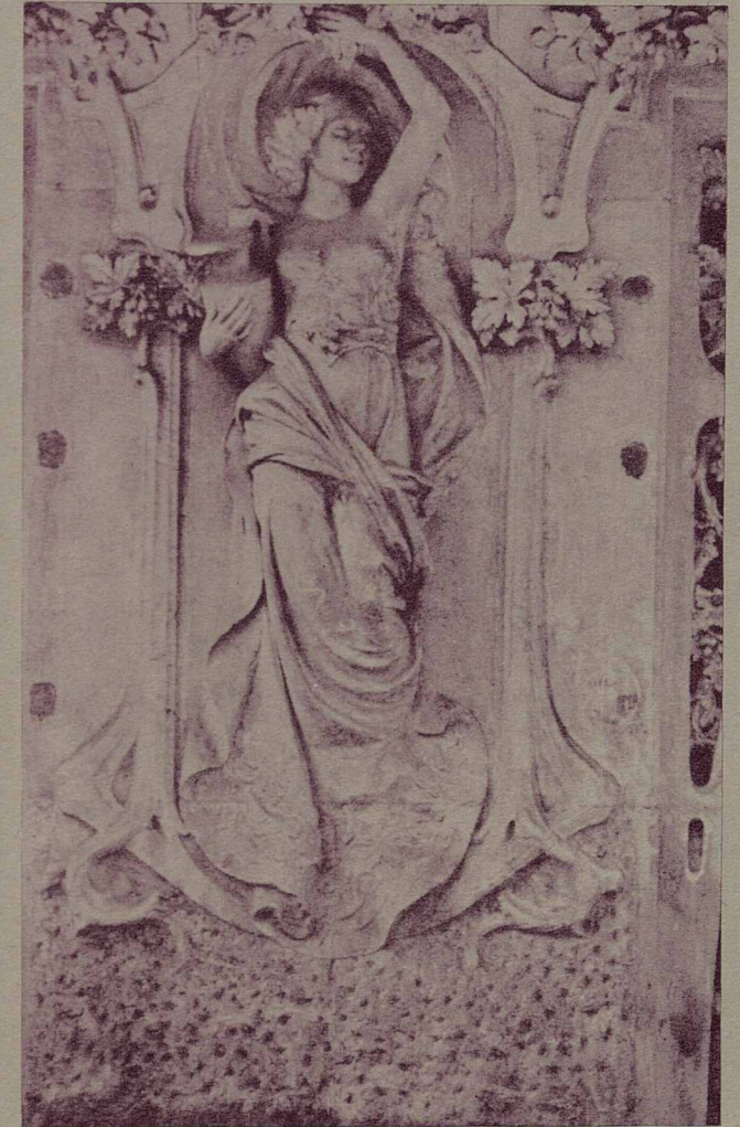
Detall façana - Can Blanxart - Avgda. Joan Prim, 11