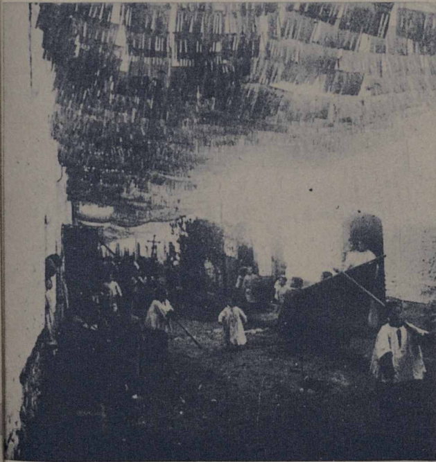
Carrer de Corró, Festa dels Sts. Metges a finals del segle XIX.