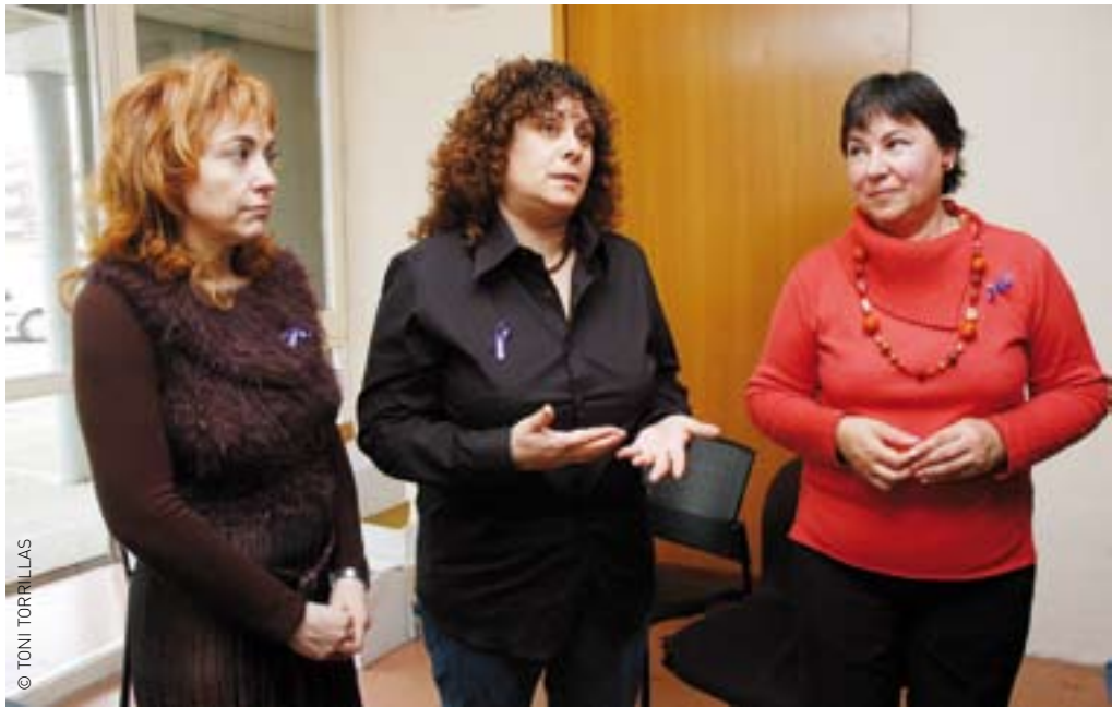
Tres dones que han pres part en el projecte Francesca Martín

Entre el 20 de juliol de 2005 i el 10 de març, les 43 dones participants -el 90% de Granollers- han rebut formacions i serveis personalitzats. Sel's oferien mòduls d'informàtica, motivació i assertivitat, tècniques de recerca de feina, de re-