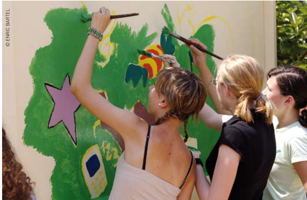
Integrants de la comissió de seguiment del congrés de ciutats educadores Granollers 2009