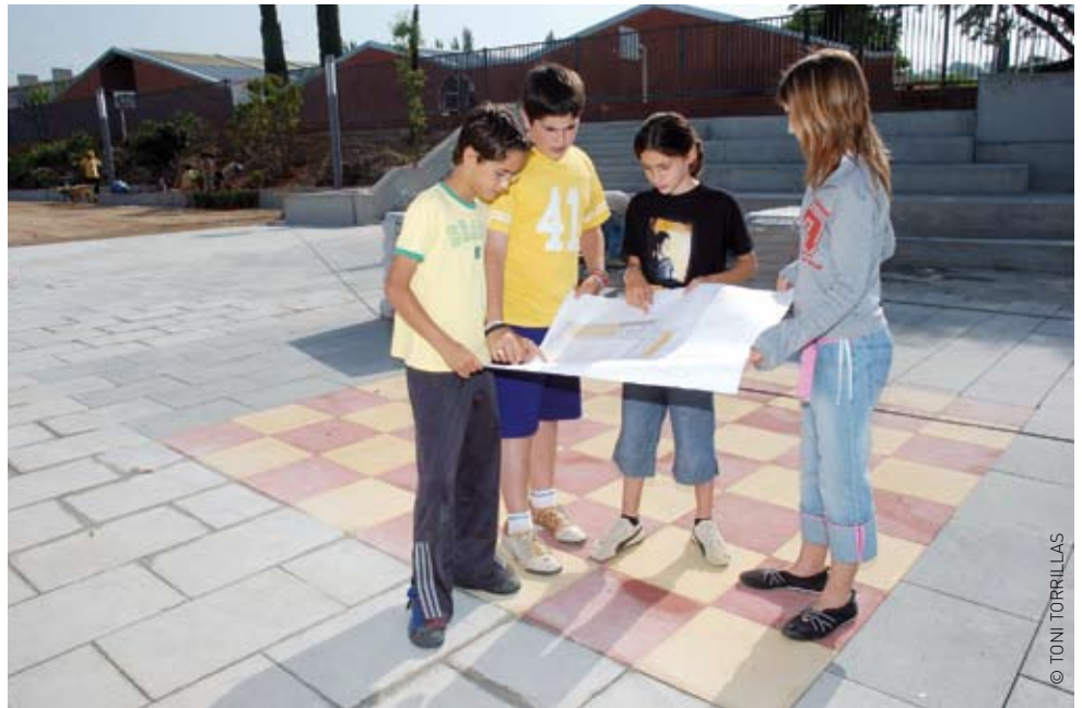
Alumnes del CEIP Mestres Montaña al parc de la Mediterrània