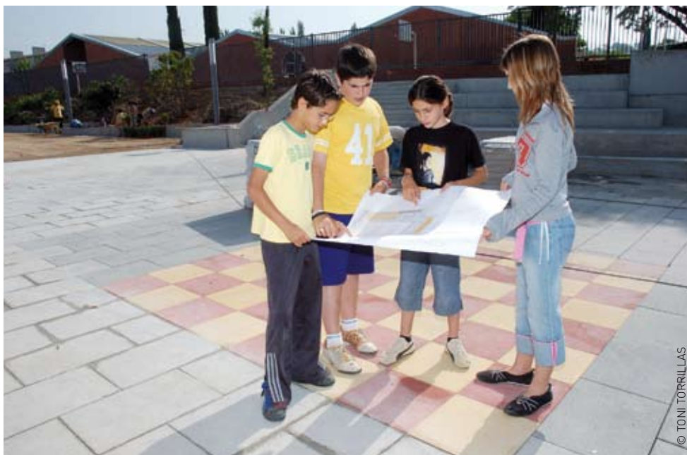
Alumnes del CEIP Mestres Montaña al parc de la Mediterrània