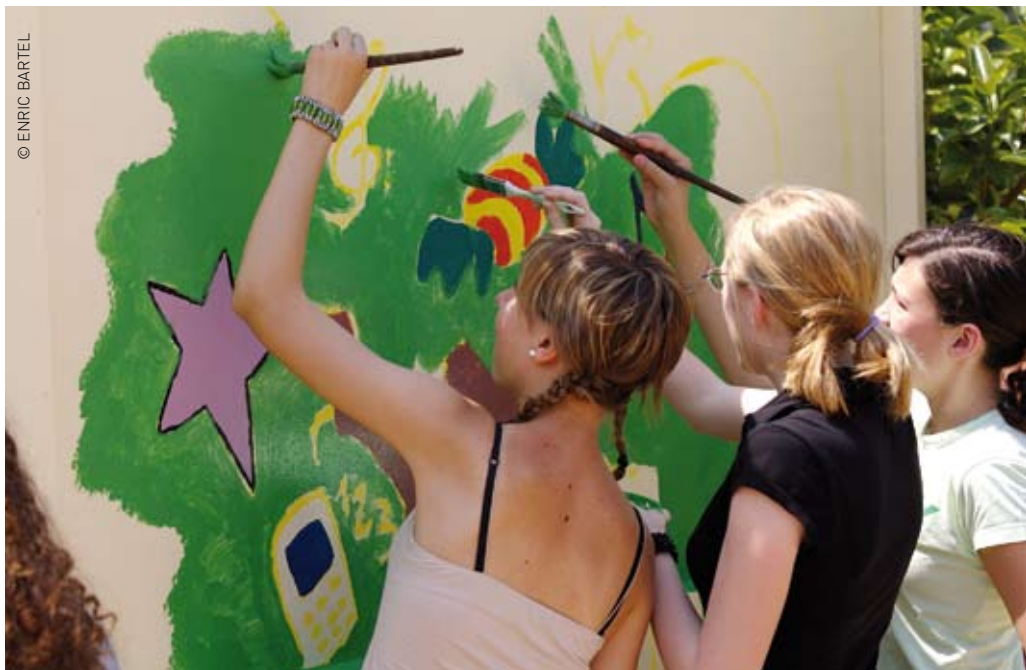
Integrants de la comissió de seguiment del congrés de ciutats educadores Granollers 2009