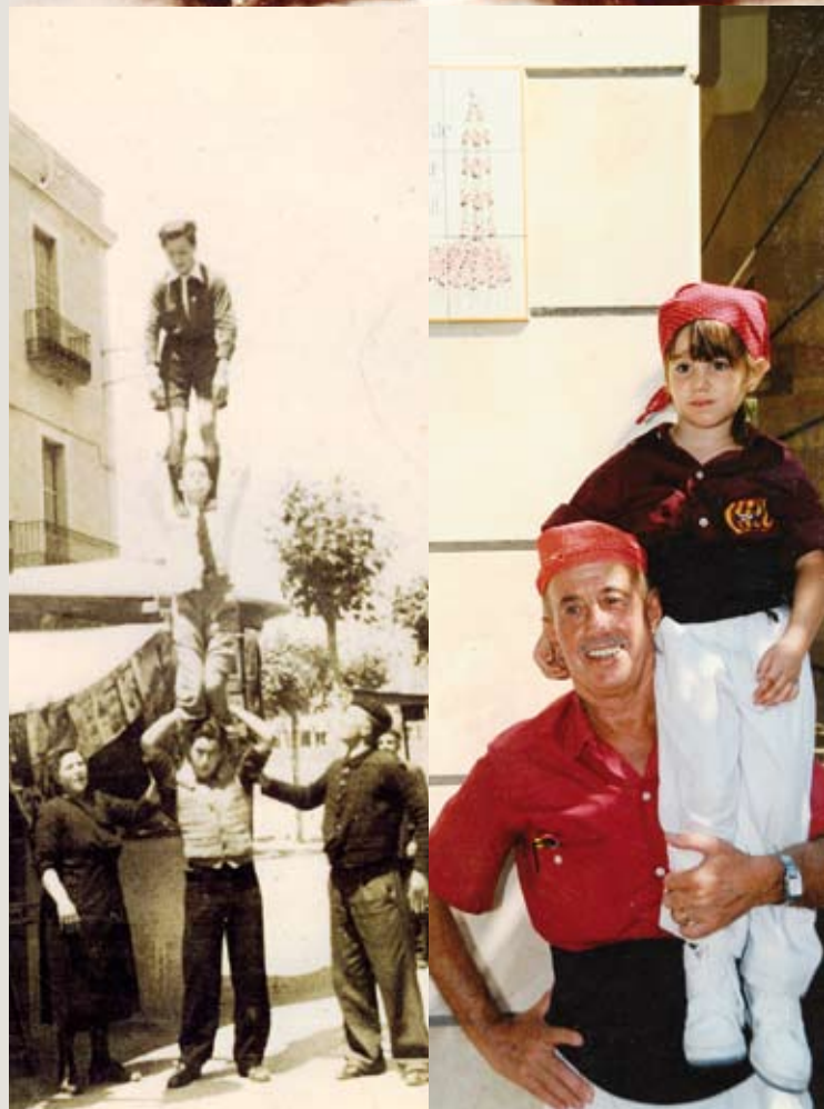
Un pilar de tres a l’any 1940, davant del quiosc de Can Sínia