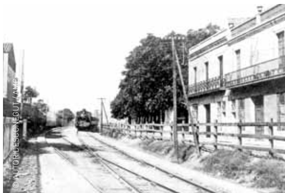
A dalt, el carrer de Girona durant els anys 20; al mig, davant el camp de futbol de l'Esport Club Granollers, els anys 50, quan la via del tren continuava essent una barrera; a baix, quan es construïen grans blocs d'habitatges, els anys 70.