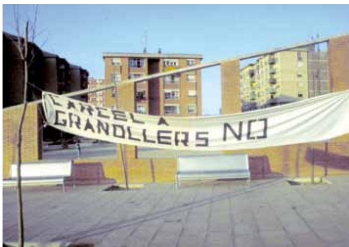
Protesta en contra de la presó de Quatre Camins a la plaça de Can Bassa, anys 80.

A finals de 1983, es decideix construir la presó de Quatre Camins. L'Associació de Veïns de Can Bassa acorda crear, juntament amb associacions de Palou i Sant Miquel, una comissió antipresó. Es reuneixen per parlar de com evitar-ne la construcció, ja que es creu que el projecte afectarà negativament els barris propers a la presó, al Centre Montserrat Montero i a tot Granollers en general. Finalment, la presó es va inaugurar el juliol de 1989.