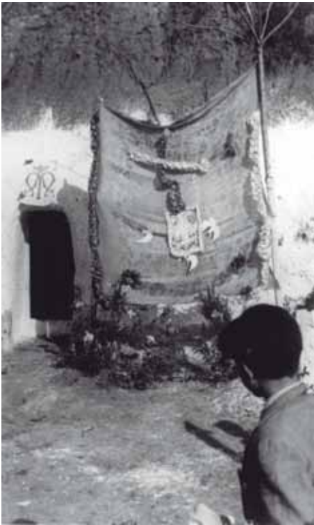
1952.