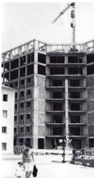
1961. Joan Font / Ajuntament de Granollers / (1/7/2012) AMGr-Arxiu d'Imatges

El conjunt de vivendes es va construir en dues fases. Primer, el Grupo Liberación l'any 1957, amb 200 habitatges. L'any 1961 van ser adjudicats els edificis de la segona fase, el Grupo Victoria, amb 350 habitatges més. Tots els pisos del que més tard seria el Grup Primer de Maig van ser adjudicats per sorteig als seus habitants.