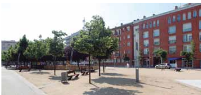
2012. Pere Cornellas

L’última onada de construcció al barri, a partir dels anys 90, va representar l’ocupació dels últims solars buits, van ser els blocs que envolten la plaça de les Hortes. El barri va guanyar en habitatges i en espais de lleure, amb la plaça de les Hortes i el parc del Congost.