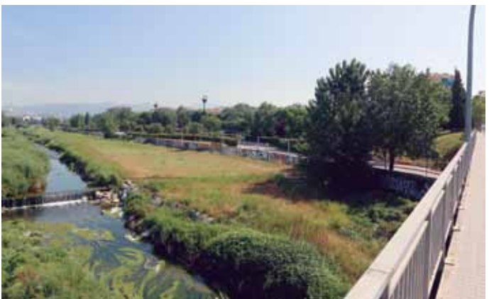
2012. Pere Cornellas

Al principi, predominaven grans zones de camps de conreu regats amb l'aigua del Congost a través de sèquies i pous.