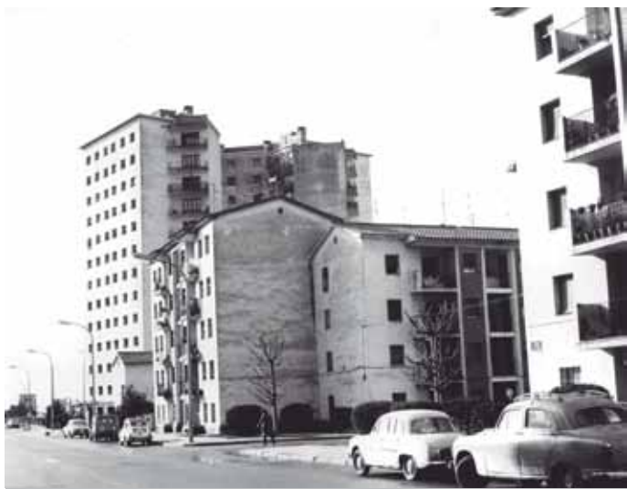
1970.