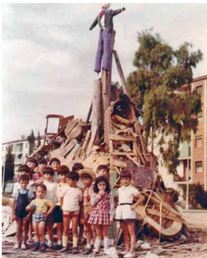
Autor desconegut / Facebook

“Pel primer de maig es feia una cursa popular pels carrers del barri. Començàvem al carrer Roger de Flor i acabàvem al camp de futbol on feiem una botifarrada. Ara fan una marxa a peu i acaben amb un esmorzar. Algun diumenge també fan havaneres i coses per als nens. És un barri molt actiu a nivell general de ciutat”. E. Pey