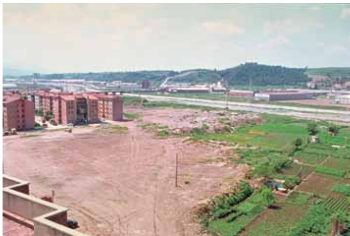
(1/7/2012) 1977. «Memòria històrica dels barris de Granollers. Grup Primer de Maig» Publicacions sobre barris / Ajuntament de Granollers.