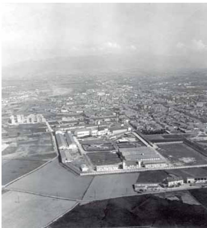
1951. Trabajos aéreos fotogramétricos

“Un bloc de pisos i tot envoltat d’horts. Hi havia un rec petit darrere dels bloc de pisos i un caminet que donava a la fàbrica de Can Comas”. P. Samon