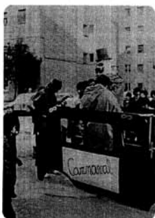
Any II - Febrer - 1981 - Nº 3

del Camí Ral - GRANOLLERS BUTLLETÍ DE L'ASSOCIACIÓ DE VEÏNS, I DE L'ASSOCIACIÓ DE PARES C.N. VICTORIA