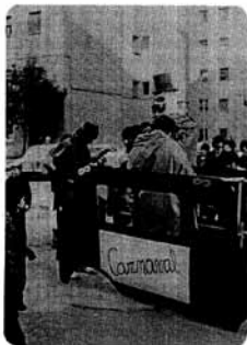
Any II - Febrer - 1981 - Nº 3

del Camí Ral - GRANOLLERS BUTLLETÍ DE L'ASSOCIACIÓ DE VEÏNS, I DE L'ASSOCIACIÓ DE PARES C.N. VICTORIA