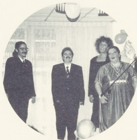
Les actuacions van ser uns dels aspectes més celebrats.