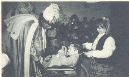
La nit de Reis és una nit d'il·lusió per tothom.

Aquest any n'ha fet deu que els Reis de l'Orient fan parada al nostre Hospital per oferir il·lusió a totes les persones que, per aquestes dates, resten ingressades al centre.