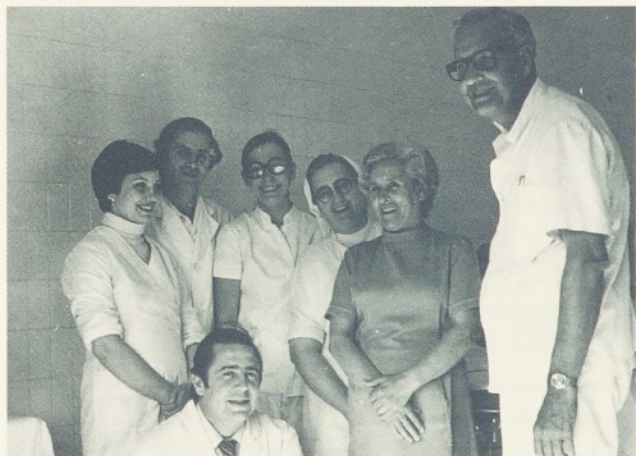
La Gna. Mercè amb alguns dels qui van ser els seus companys de feina.

La vida s'ha de viure amb joia i plenitud perquè passa molt de pressa i hem d'estar sempre a punt per fer un servei perquè una persona egoista no pot ser mai feliç.