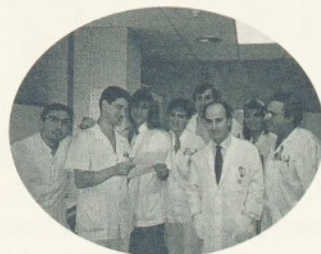
L'equip del Servei de Diagnòstic per Imatge.

Aquest pòster tracta de les variants anatòmiques dels recessos superiors del pericardi en els nens, que poden donar origen a falses