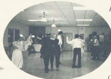
Els aprenents de ballarins van passar estones molt agradables.

Vàrem començar aprenent els passos bàsics de cada ball, primer practicant cada pas individualment i després fent-ho amb la parella. Al principi havíem d'estar comptant els passos i l'únic que veus són els peus de la teva parella. La veritat és que la música ni la sents, però de mica en mica comences a agafar més desimboltura, intentes seguir més el ritme de la música i